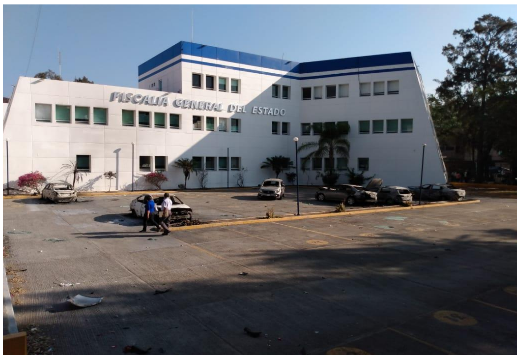
Figura 6. Once vehículos incendiados como forma de protesta estudiantil en la sede de la Fiscalía General del Estado