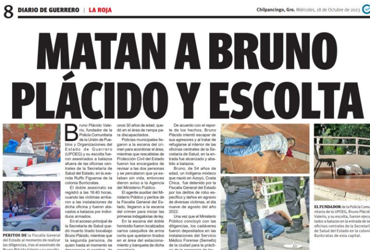
Figura 5. Los asesinatos son cosa de todos los días, a plena luz y en lugares céntricos, con la impunidad como daño mayor en la dignidad humana.

¿Cuál sería la explicación de que en los ámbitos en los cuales con mayor obligación profesional deberían respetarse el orden elemental del Lenguaje y la Palabra? No es difícil dejarlo en claro en la mesa del debate y el análisis. La violencia en Guerrero es ancestral, a pesar de su pasado glorioso, nacionalista, pues no se explica la Historia de México sin la aportación de sangre y vidas de los hijos de las Montañas del Sur, pero se ha acentuado en las recientes dos décadas.